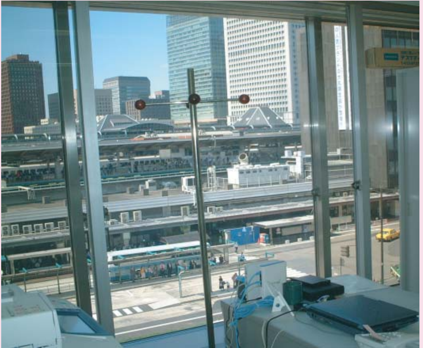
東京都中央区 東京事務所（背景：東京駅）