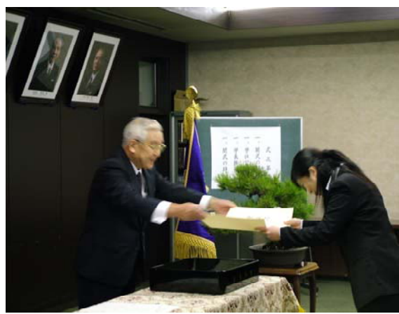
学長から学位記を授与される卒業生