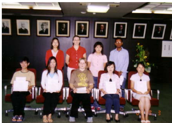
授与式出席の留学生