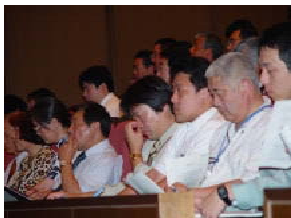
説明に熱心に聞き入る事務系職員