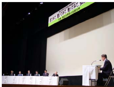
「社会貢献」をテーマに行ったパネルディスカッション