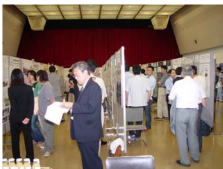
個人研究・学内研究会のパネル展示