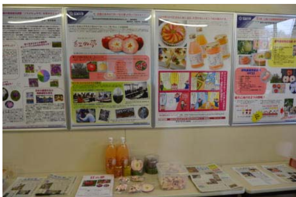
教員らによる研究に関するパネル展示の様子