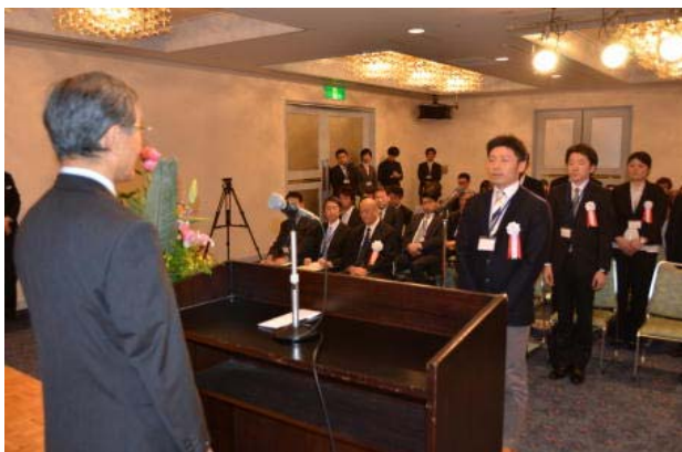
受講生代表による挨拶

また、特別講演会終了後、受講生・授業担当者・事業関係者を交えた情報交換会が開催され、活発な意見・情報交換が行われました。