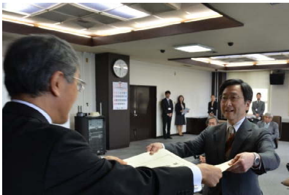
名誉教授称号授与式の様子