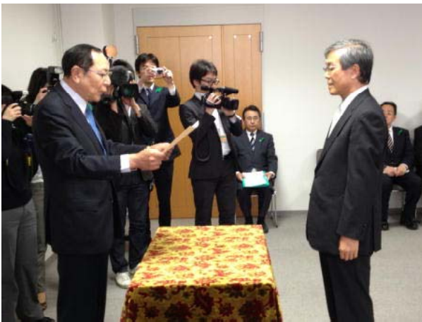
感謝状伝達式の様子

本学では、東日本大震災が発生した直後から、DMAT派遣や被災地域病院等への医療支援、福島県へ「被ばく状況調査チーム」等の派遣、岩手県野田村をはじめとした被災地へのボランティア活動など様々な支援活動を行っており、今回の感謝状伝達はこれらの活動が評価されたものです。