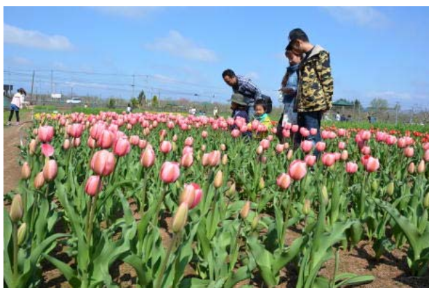
来場者でにぎわうピーターパン・チューリップ園

また、会場では、リンゴの研究成果等のパネル展示が行われたほか、教員らによるチューリップやリンゴの研究に関する講演会が行われ、多くの来場者が耳を傾けていました。藤崎農場産のリンゴやリンゴジャム、金木農場産の米の販売も行われ、お目当ての品を買い求めようとする来場者でにぎわっていました。