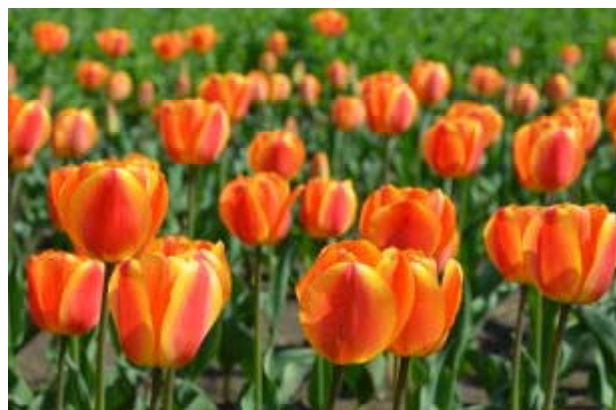
色とりどりのチューリップ