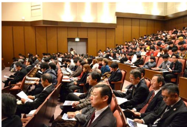
講演に耳を傾ける参加者