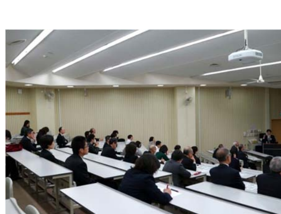
熱心に聞き入る聴講者