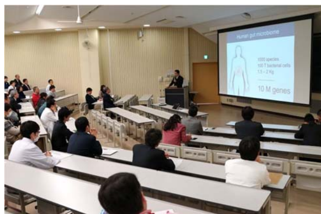
熱心に聞き入る聴講者