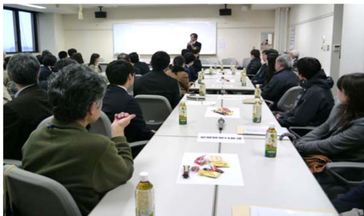
教員、先輩学生、合格者、保護者との懇談会