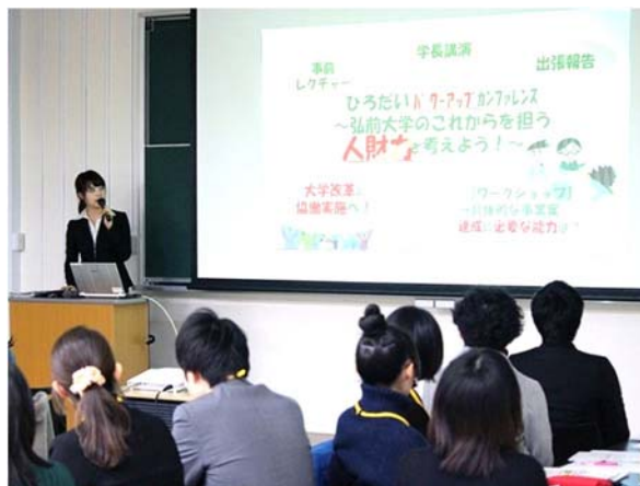
若手職員による他大学での取組事例紹介