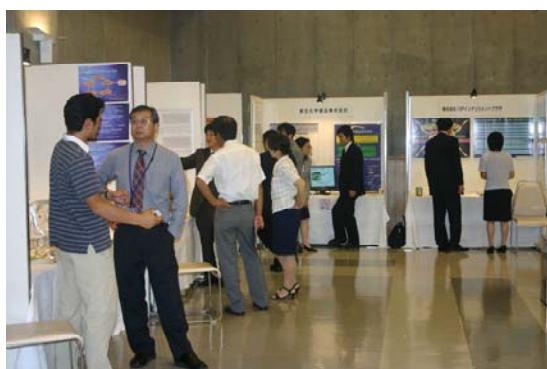
産学官連携事業の紹介でのブース展示