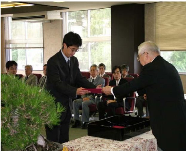
学長から学位記を授与される卒業生