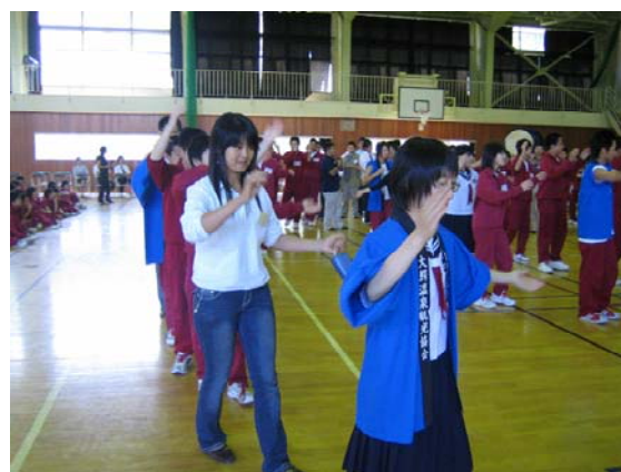
「大鰐小唄の流し踊り」で広がる大鰐中学校との交流の輪