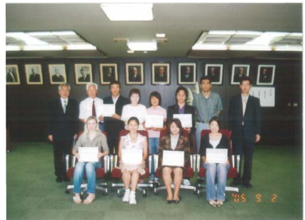
授与式出席の留学生、副学長、留学生センター長、指導教員