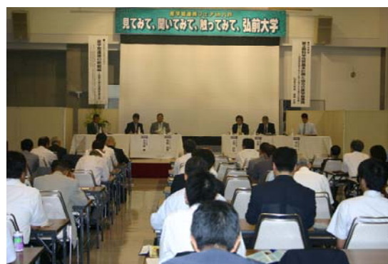
活発な意見交換がされたパネルディスカッション