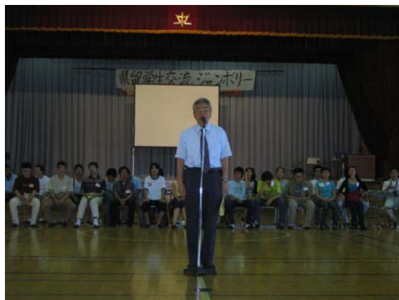
大鰐中学校との交流会で挨拶する大関副学長

今回参加した留学生は、県内中学生と交流し、北日本、特に青森県津軽地方の生活に根ざした伝統的文化と豊かな自然に触れ、日本文化への理解を深めました。