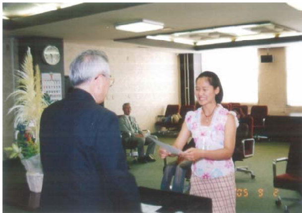
大関副学長から修了証書を授与される留学生

授与式には、留学生、関係学部長並びに指導教員等が出席し、大関副学長から出席した7名の留学生一人一人に修了証書が手渡されました。引き続き、副学長から、本学関係教職員への謝辞とともに、日本の伝統文化に触れ、多くの友人を得た留学生に対し、帰国後も弘前で過ごした春夏秋冬を通じて弘前大学で学んだ専門知識を生かし、それぞれの国で日本との国際交流の架け橋として活躍願いたい旨の挨拶がありました。