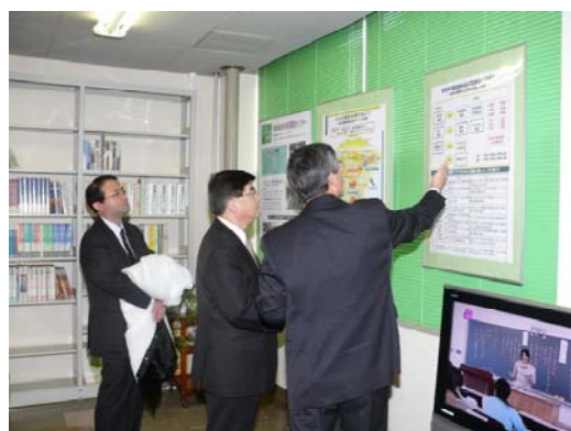
教育学部附属教員養成学研究センターの 説明を受ける結城次官(中央)