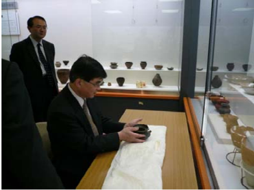
人文学部附属亀ヶ岡文化研究センターの説明を受ける結城次官（中央）