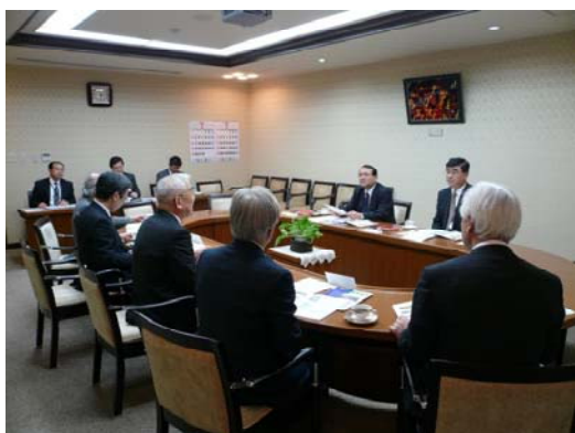
遠藤学長及び各理事と懇談する結城次官 (奥の右が結城次官、左は丸山補佐)