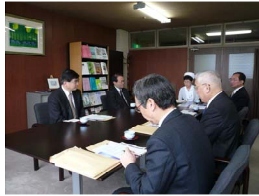
医学部附属病院の概要説明を受ける結城次官（左が結城次官）