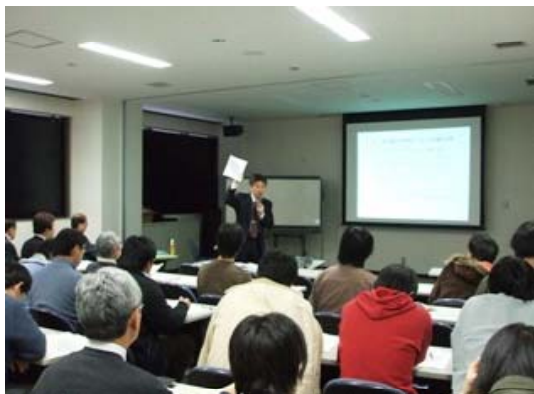
弁理士による講演の様子（一般編）

今回の知財塾は、昨年度の基礎編に引き続き、内容のレベルを上げて開催したものであり、講演中・講演後は熱心な質疑応答が行われました。また、学生の参加者らも熱心にIPDL検索を行うなど、特許出願について理解を深める有意義な講演会となりました。