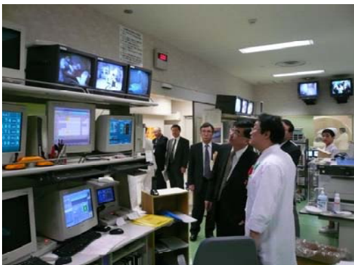
医学部附属病院放射線部の説明を受ける結城次官（右から2番目）