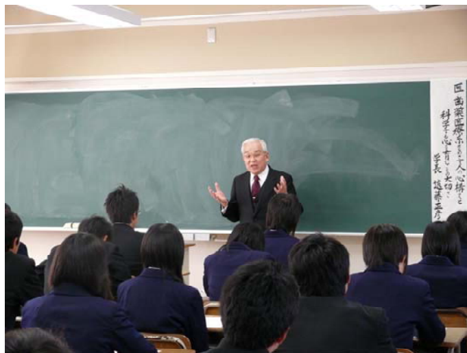
高校生を前に講義する遠藤学長

「弘前大学ドリーム講座」は、19年度以降も実施していく予定で、今年度の実施を基に、より良いものを提供できるよう検討しています。