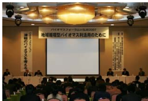
活発な意見交換が行われた パネルディスカッションの様子