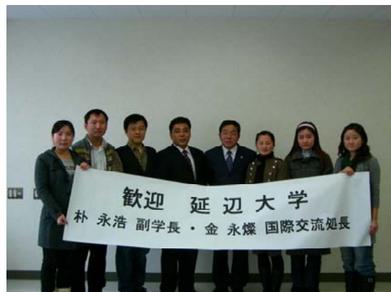
延辺大学留学生との懇談会（総合教育棟）