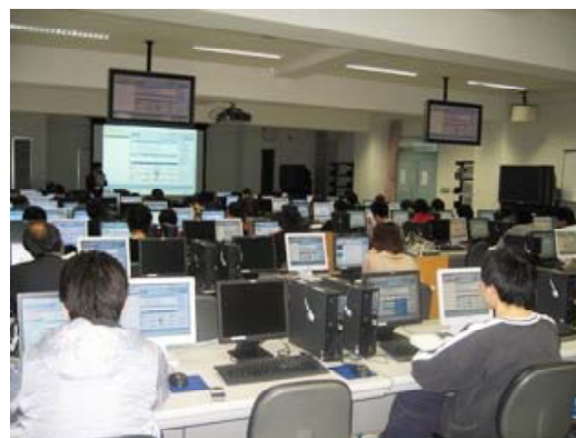
IPDL検索を行う出席者の様子（応用編）