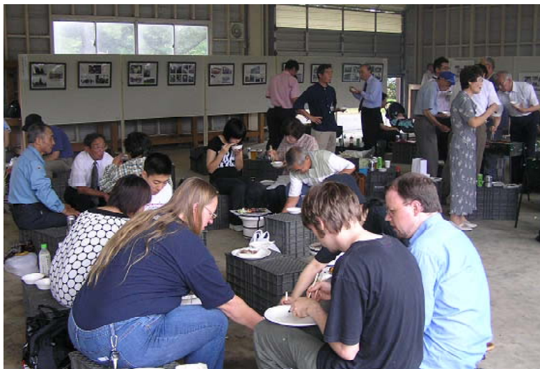
焼き肉を楽しむ参加者及び一般来場者