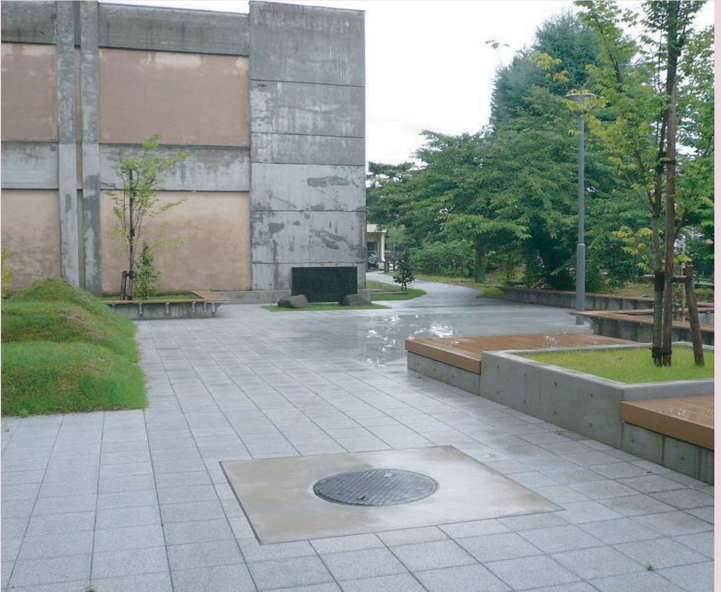
弘前大学教育学部創立百三十周年記念庭園