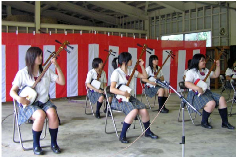
金木高校三味線部の三味線演奏