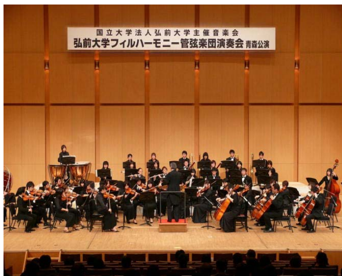
演奏する弘前大学フィルハーモニー管弦楽団

音楽会終了後、来場者からは「とても素晴らしい演奏でした」「レベルの向上に感激しました」など感激の言葉が寄せられました。