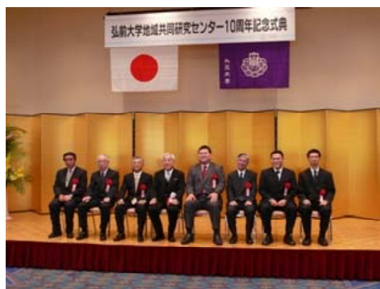
弘前大学表彰の記念撮影