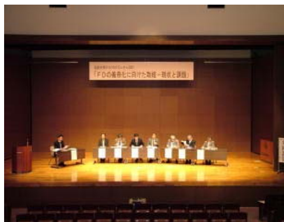
司会並びにパネリスト