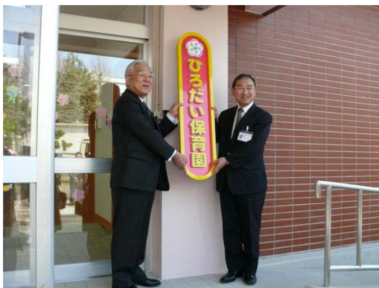
看板上掲する遠藤学長㊦と花田病院長

保育園は、大学職員、大学院生のための「子育てと仕事」、「子育てと学業」といった両立支援策のひとつとして設置された。床面積約330㎡、屋外遊技場約100㎡の平屋建てで、保育室のほか給食室、沐浴室などを備える。利用できるのは学内の全職員で、定員に空きがある場合は大学院生も利用可能。月極めの常時保育、一時保育合わせて四十人の園児を受け入れ可能で、現在約30人が利用を申し込んでいる。