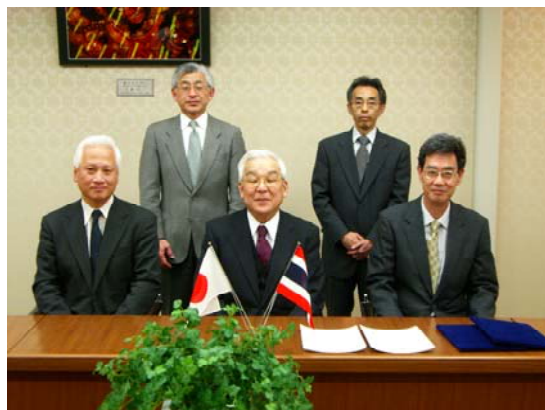
コンケン大学へ郵送する署名済みの協定書