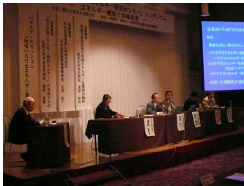
パネルディスカッションの様子（南條学長特別補佐㊦）