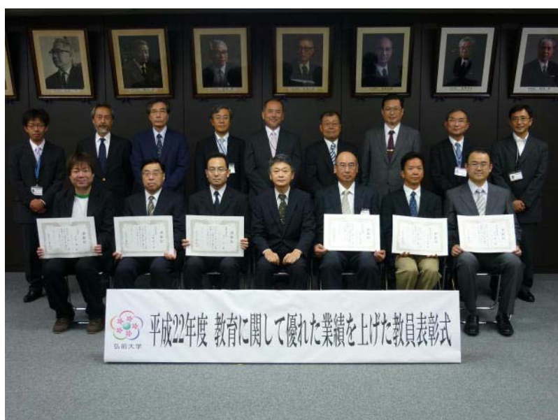
神田教育・学生担当理事（前列右から4人目）と表彰教員