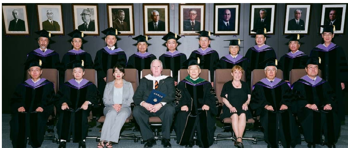
関係者による記念撮影

本学では、学術文化又は国際交流の発展に多大な貢献があり、教育研究の進展に寄与した功績を認めた際に弘前大学名誉博士の称号を授与しており、トーマス・A・レークス学長は、9人目の受章者となります。