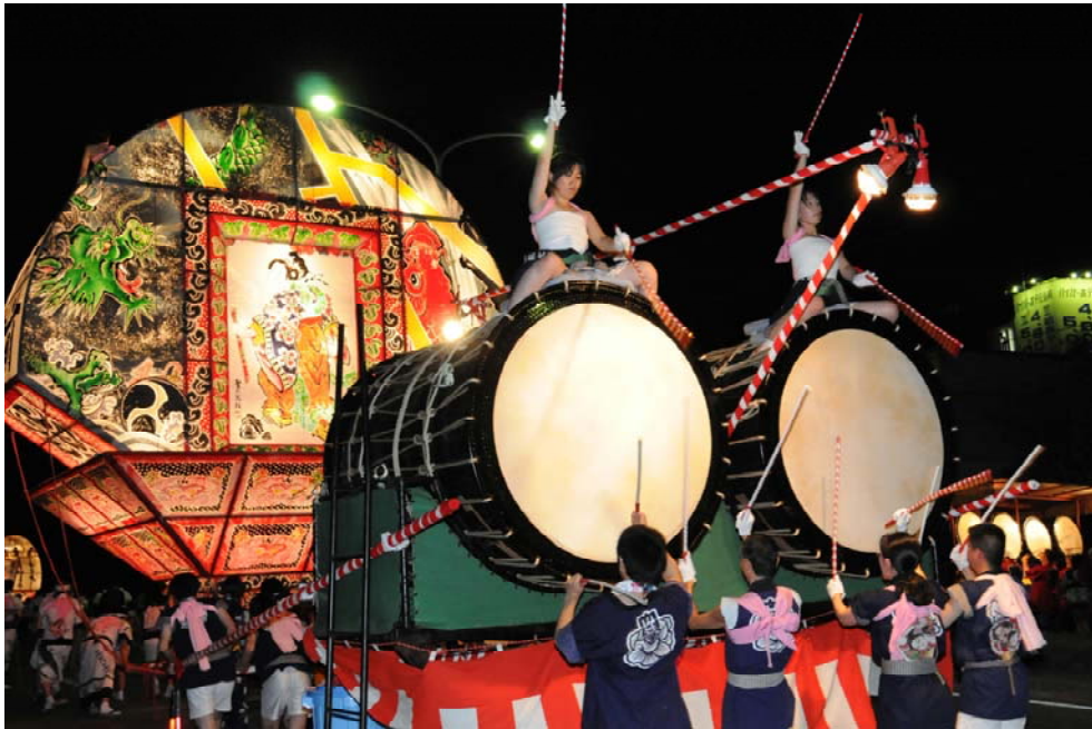
観客を魅了する大太鼓