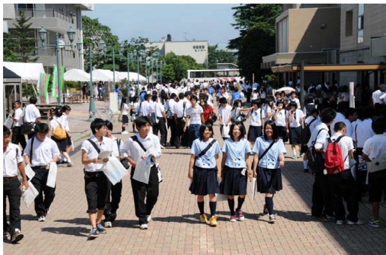
キャンパスを散策する高校生等

特別企画「学長と話そう」では、遠藤学長が多くの高校生らと懇談を行い、本学の教育理念、魅力などについて理解を深め、本学への進学意欲を高めていました。