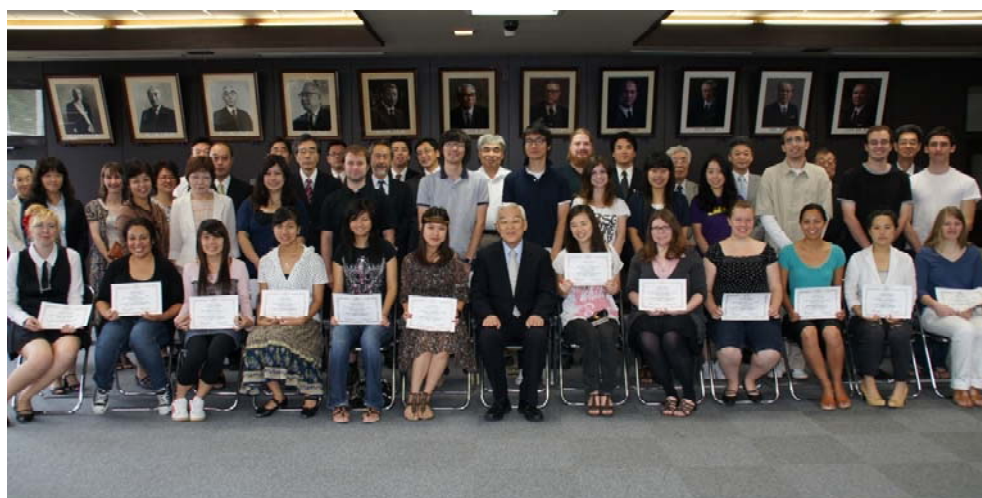
授与式出席の留学生並びに関係教職員