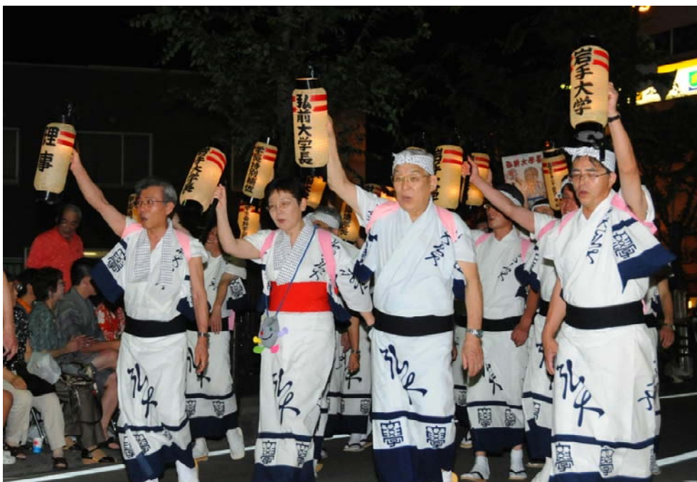
先導を務める左2番目から菅原岩手大学副学長、遠藤学長、西崎岩手大学副学長ら