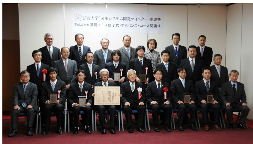
関係者による記念撮影