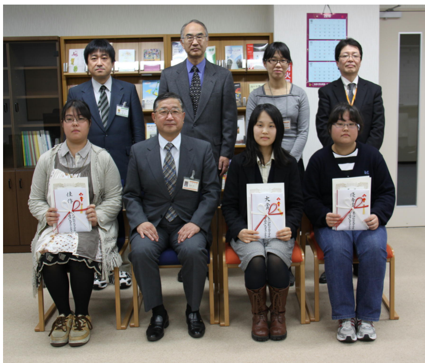
受賞者と関係者による記念撮影

若者の『言語力』不足がマスコミ等で論じられる中、本学が先駆的に取り組んできたユニークな事業として他大学からも注目されています。