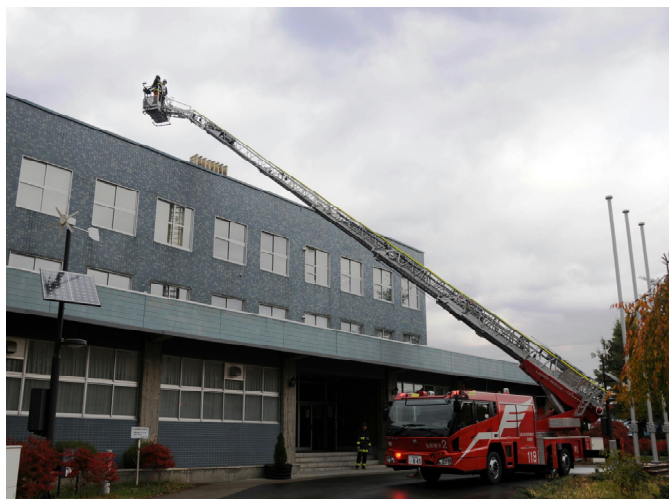
はしご車を使用した事務局屋上からの救助訓練

また、午後には多目的グラウンドにおいて、実際の火災に際しても冷静な対応ができるよう消火器で火を消し止める訓練を行い、消火器の操作等についての説明に学生・教職員ともに熱心に耳を傾けていました。