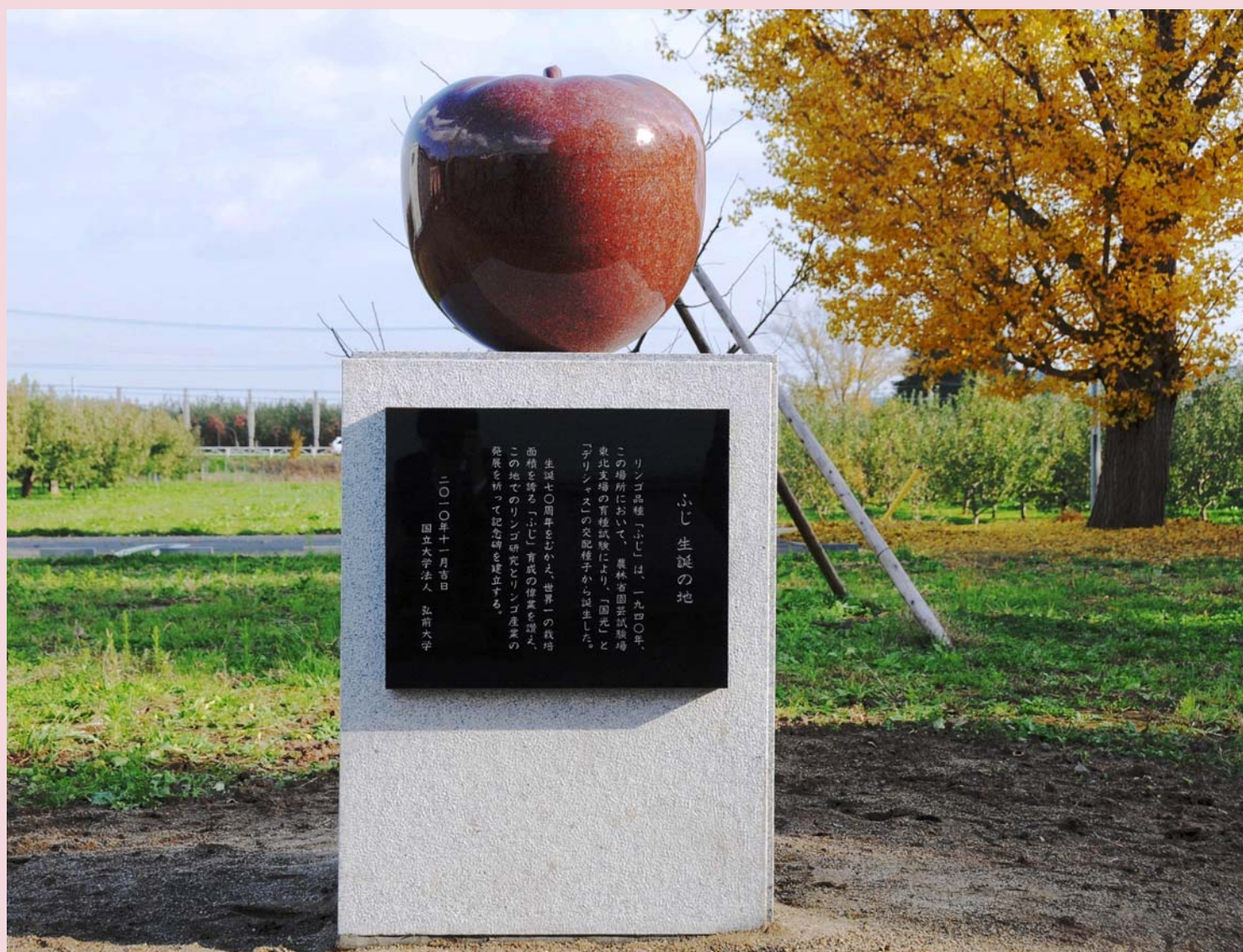
リンゴ品種「ふじ」生誕70周年 記念碑