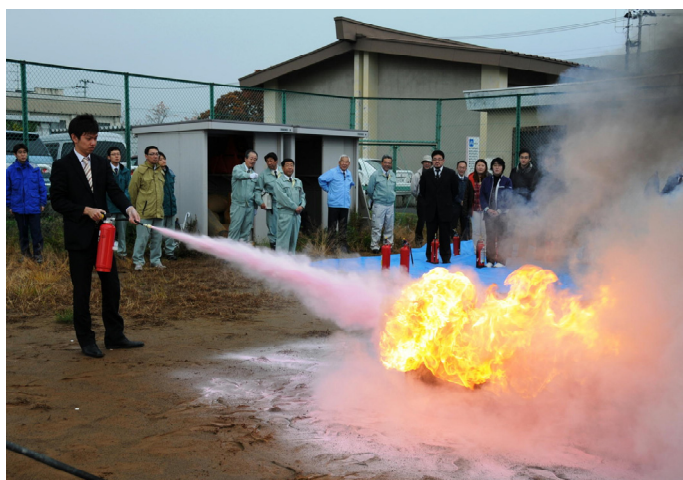
午後に行われた消火器消火訓練