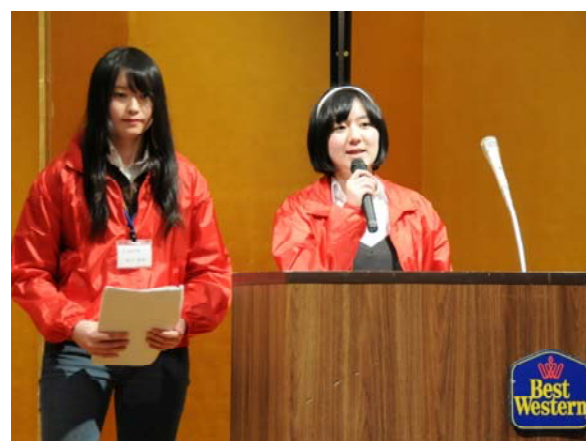
今年度の取組の概要と成果を発表する学生