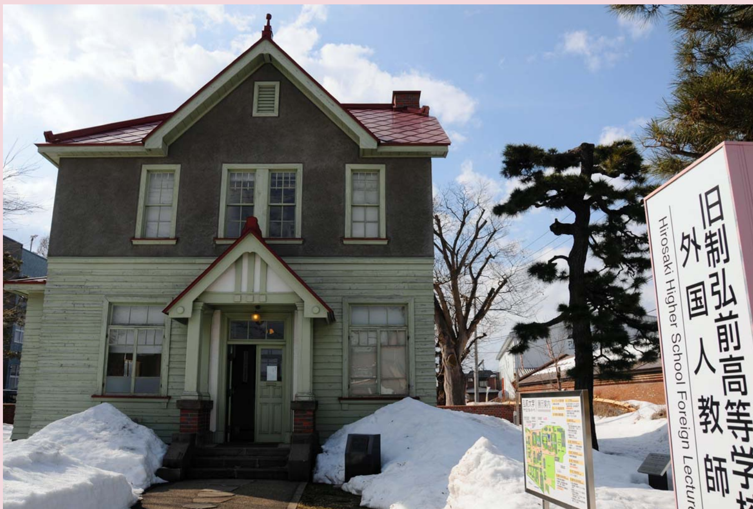
旧制弘前高等学校 外国人教師館