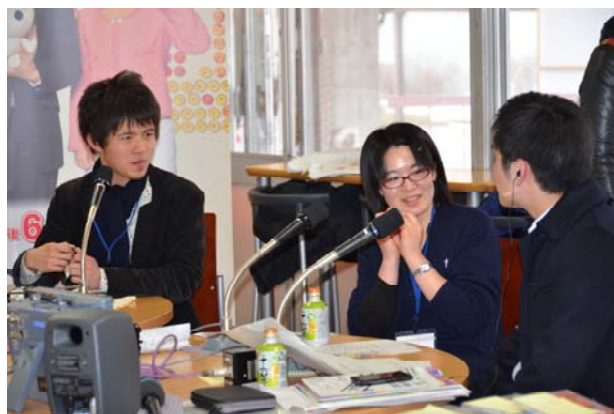
学生食堂に設けられたスタジオ