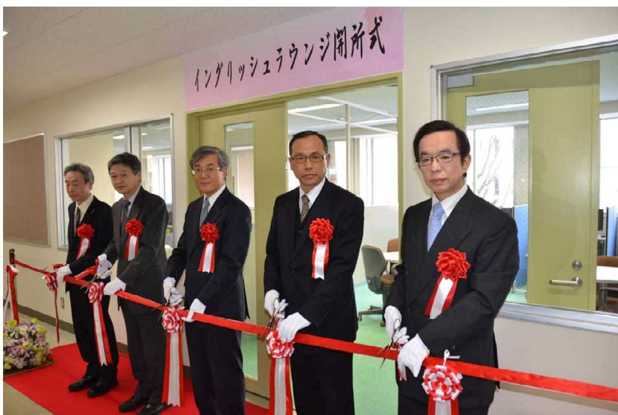
関係者によるテープカット

イングリッシュラウンジは学生の英語力（特に英会話力）の向上を目的にしており、常駐のネイティブスピーカーの教員が英会話やビジネス英語の指導等を行います。