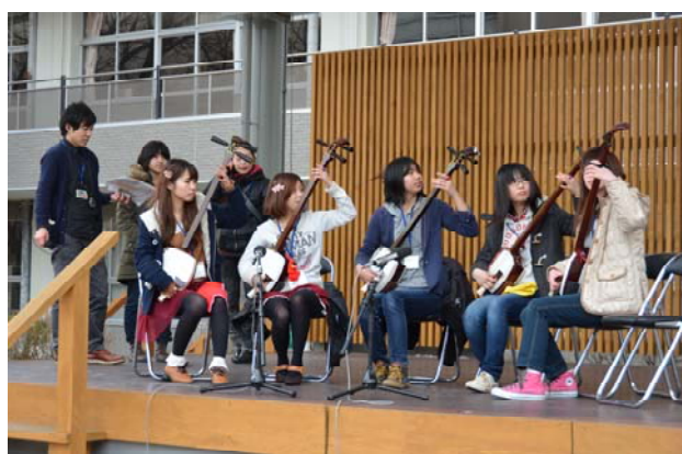
三味線サークルによる生演奏