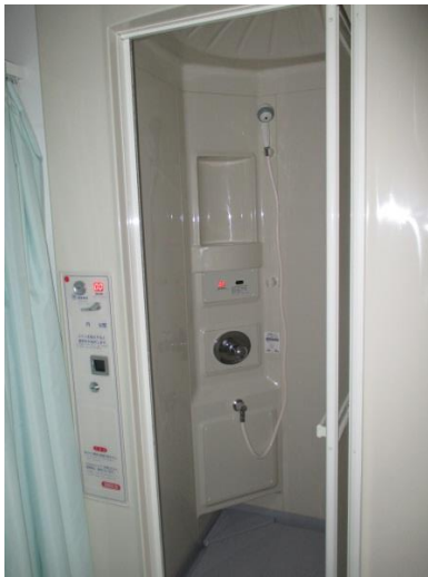
コインシャワー室