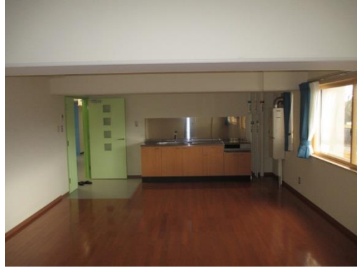
オープンリビングキッチン