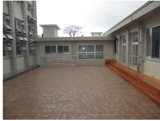
中庭 (インターロッキング)