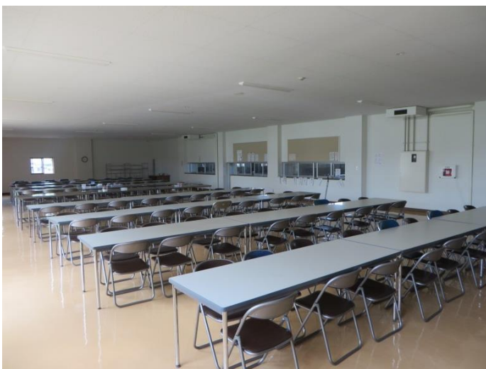
食 堂（北鷹寮と共用）