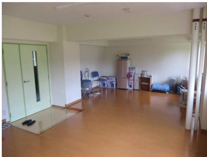
オープンリビング