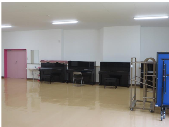
娯楽室（北鷹寮と共用）