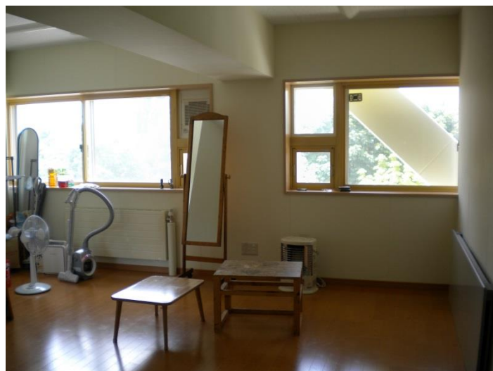
オープンリビング