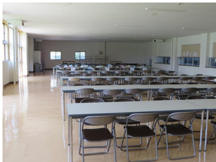
食 堂 (朋寮と共用)