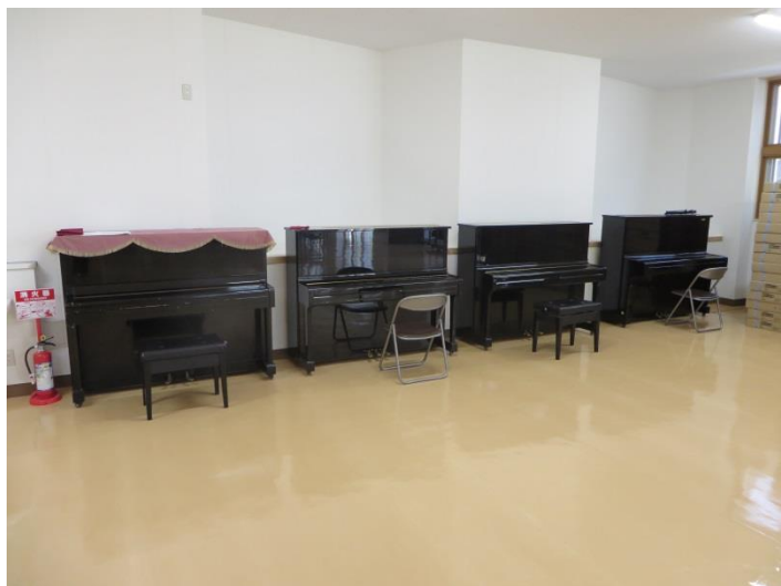
娯楽室 (朋寮と共用)