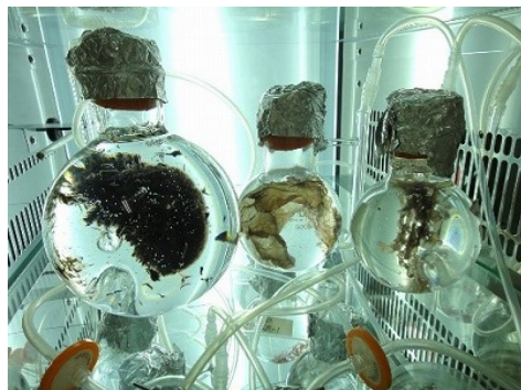
(2) 左：スサビノリの室内培養

水産植物スサビノリを用いて、人為的環境制御が生殖器官の分化・形成に与える影響を明らかにするとともに、水産植物の増養殖技術や評価に資するモデル実験系の効率化を目指す。その一環として、スサビノリの生殖器官の分化・形成に関する予備的知見の獲得を図る。将来的には、これらの知見を基に水産植物の増養殖技術の向上と発展に還元する。