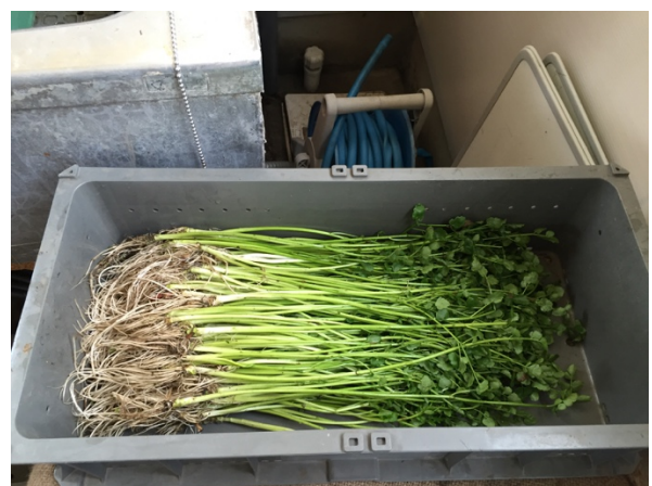
収穫期（冬季）のセリ田と一町田セリ