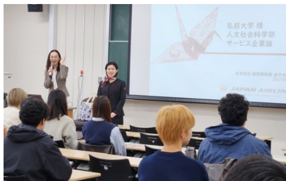
地域志向科目「サービス企業論」の様子

令和7年度は「地域志向科目」の29科目に対し、フィールドワークのバス借上げ等を支援。これにより、学生に多角的な学びの機会を提供するとともに、地域と連携した授業の充実を図ることができました。