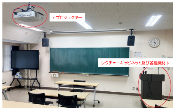
整備したプロジェクター・デジタルスイッチャー(教育学部)

教育学部、保健学研究科、理工学研究科、農学生命科学部、並びに総合教育棟の講義室における映像関連機器を更新。これにより、学生に対して質の高い教育を提供できる環境を整備することができました。