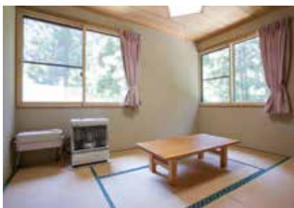
寝室(和室)..... 畳敷きの部屋が2部屋あり、1部屋に3人まで宿泊可能です。

周辺には深浦町の野球場、テニスコート、屋外ローラースケート場、キャンプ場、ゴルフ練習場、天然海水プール等の野外運動施設があり、有料で使用できます。また、町の中心部には体育館・武道館、さらに歴史民族資料館や国の重要文化財である「円覚寺」等教育的、文化的な施設があります。