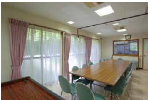
食堂 施設内には、18人が自炊生活できるように設備が整っておりますので、ゼミ合宿や友人同士また先生方を交えての懇談会もできます。