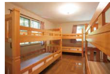
寝室(洋室) フローリングの部屋が2部屋あり、木製の2段ベッドで、1部屋に6人まで宿泊可能です。