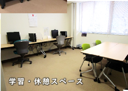
学習・休憩スペース