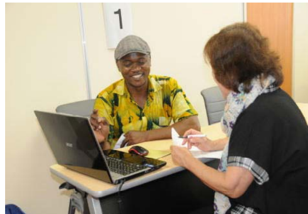
外国人留学生による日本語発表の様子