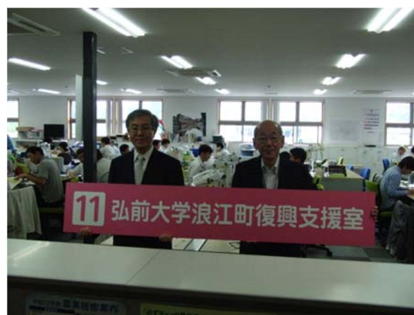
浪江町仮役場に設置される「復興支援室」看板