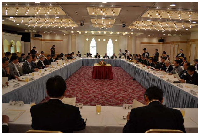
第1回青森地域産学連携懇談会の様子