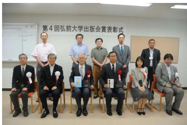
表彰式後行われた記念写真撮影

平成16年に学内組織として設立された同出版会は、大学教員の研究成果をはじめ、教養書、教科書及び地域の特色や文化の紹介など活発な出版活動を行っております。