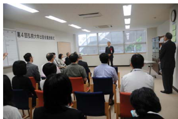
受賞者による挨拶