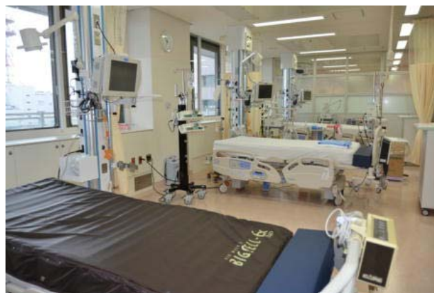
増床されたI C U病棟内