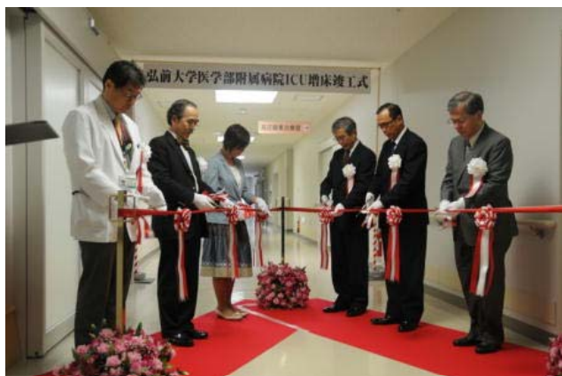
I C U増床竣工式の様子

その後、増床したI C U病棟が報道陣及び関係者に公開され、詳細な説明が行われました。