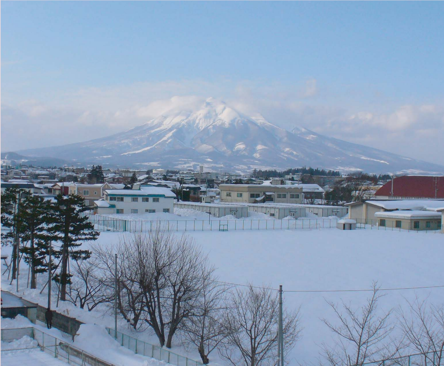
弘前市文京町 多目的広場