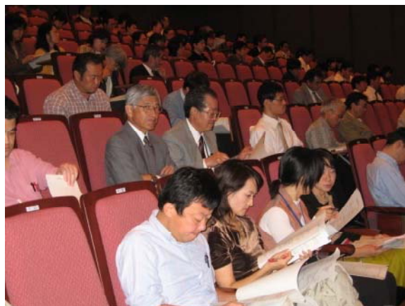
熱心に聞き入る教職員