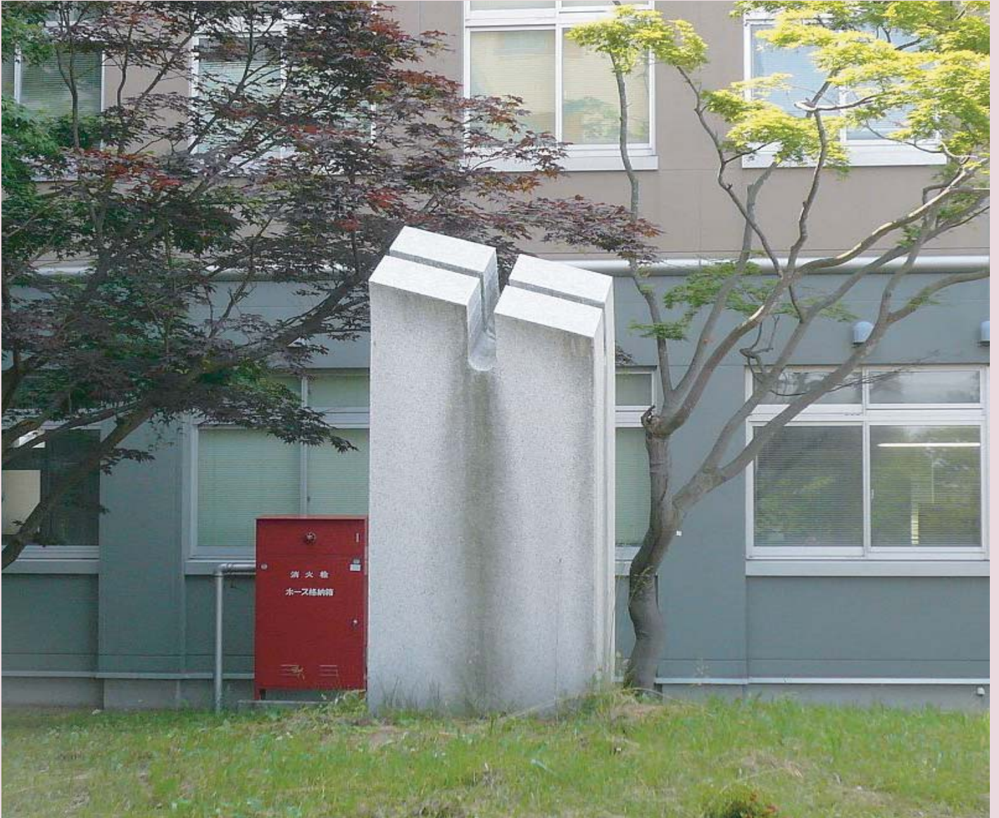
弘前大学農学部創設30周年記念モニュメント「望蒼天」