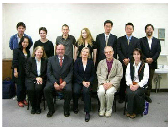
トリア大学訪問団との懇談会出席の教員、留学生、本学学生