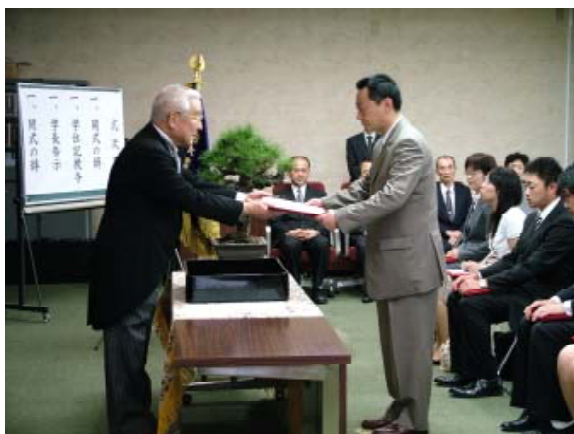
学長から学位記を授与される卒業生