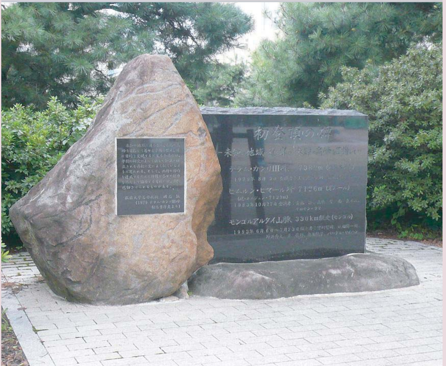
初登頂の碑（テラム・カンリIII，ヒムルン・ヒマール，モンゴルアルタイ山脈）