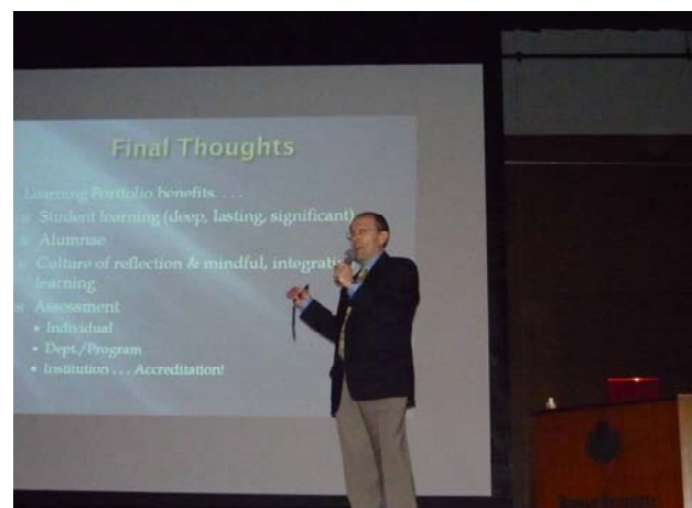
講演するジョン・ズビザレタ教授