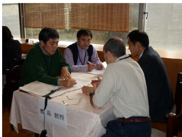
メンターリング中のメンティとメンター