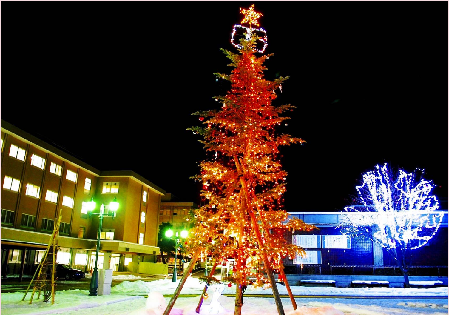
弘前大学 クリスマスツリー