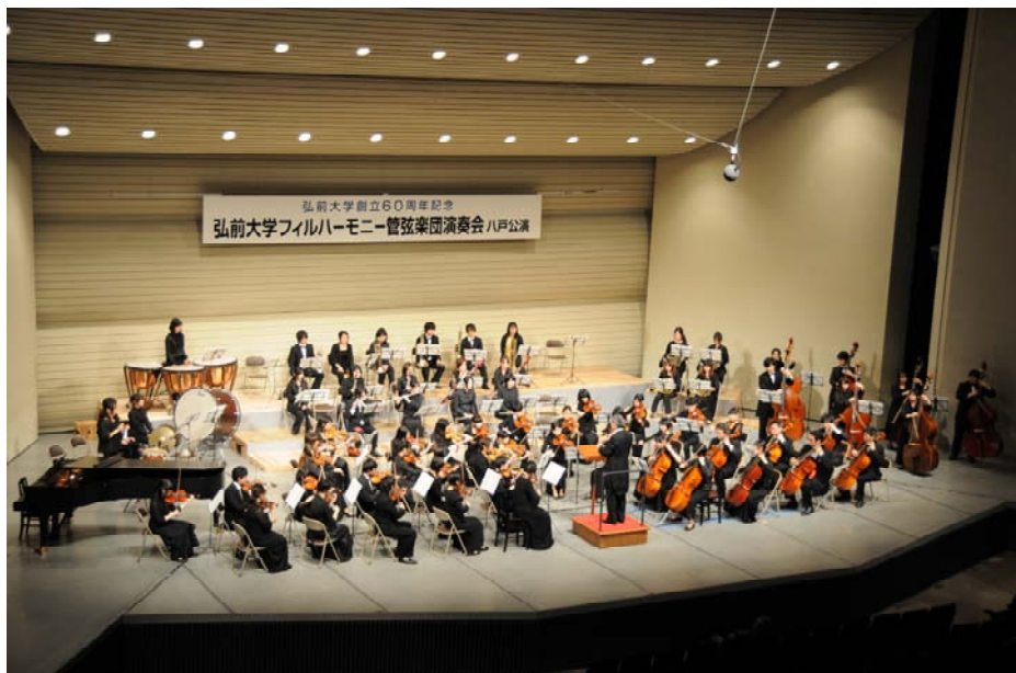
演奏する弘前大学フィルハーモニー管弦楽団

演奏会終了後、来場者からは「とても素晴らしい演奏でした」「また八戸で開催してほしい」など感謝の言葉が寄せられました。