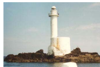
日本海中部地震で 沈降した久六島

問い合わせ先： 弘前大学大学院理工学研究科 小菅 正裕 TEL：0172-39-3652 E-mail：mkos@cc.hirosaki-u.ac.jp