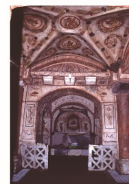
弘前大学資料館第21回企画展