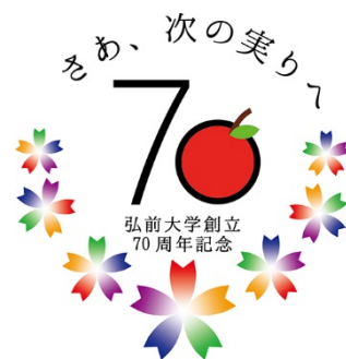
【弘前大学創立70周年記念ロゴマーク】

なお、創立70周年記念事業のホームページでは、クレジットカードによる寄附も可能でございますので、ご活用いただければ幸いと存じます。