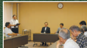
ホームルームの様子