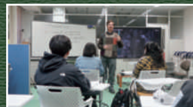
イングリッシュラウンジで生きた英語を学ぶ

入校された方にはカレッジ学生証が交付され、附属図書館、大学会館、イングリッシュラウンジなど弘前大学キャンパス内の様々な施設を利用することができ、学生と一緒にサークル活動や大学行事へも参加できます。