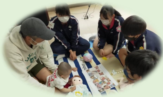
平日のふれあい体験に参加が可能だった理由