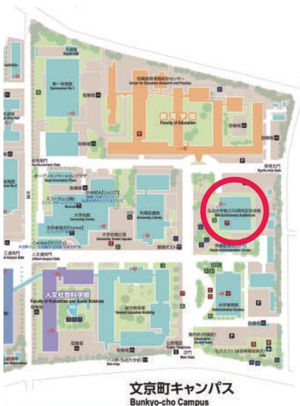
文京町キャンパス Bunkyo-cho Campus